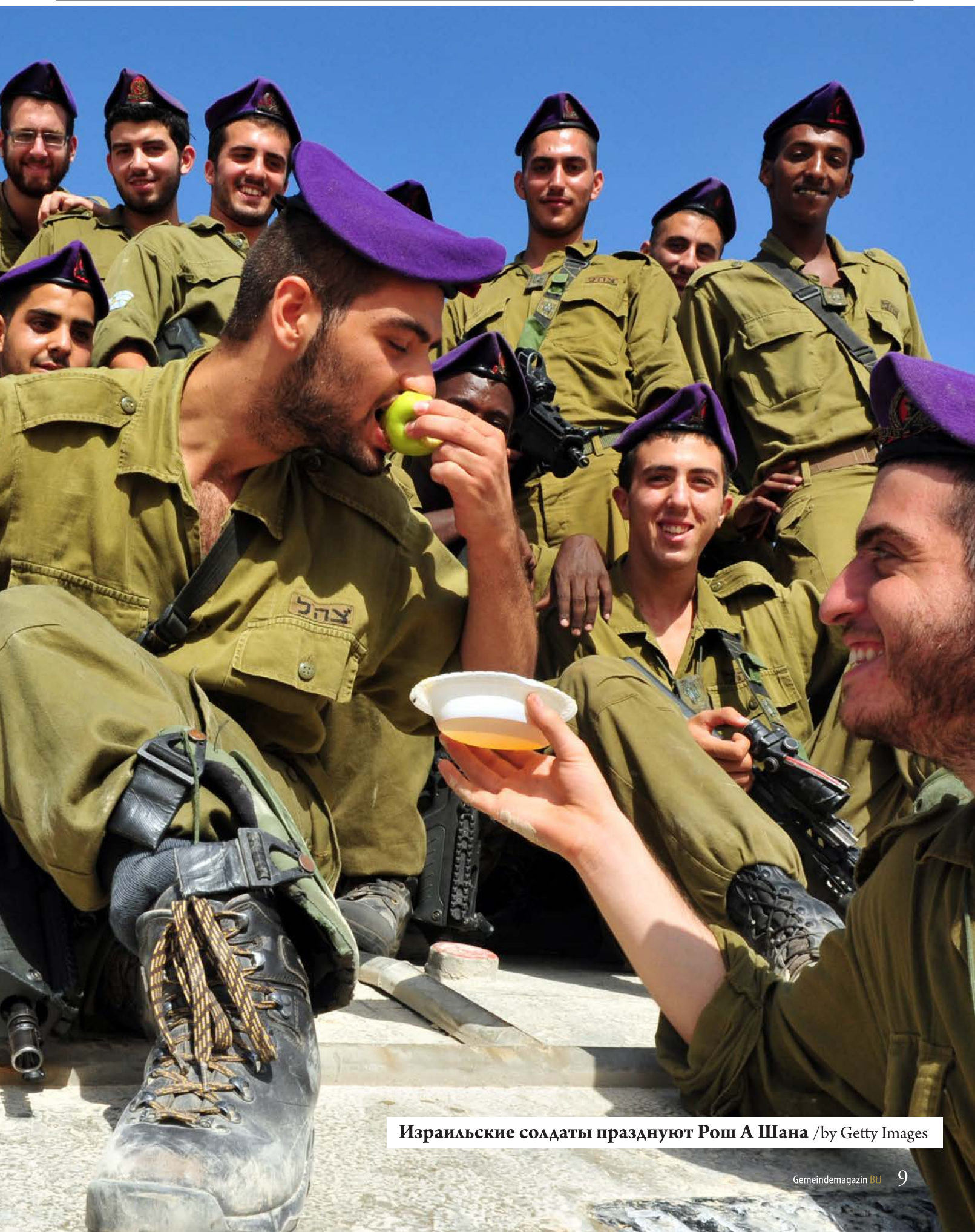
Израильские солдаты празднуют Рош А Шана